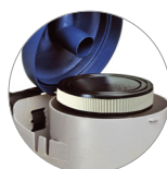
Filtro a cartuccia HEPA (optional)