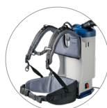
Comoda imbragatura anatomica