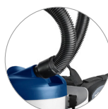
Attacco tubo flessibile