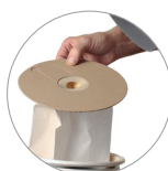
Sacchetto fleece e filtro tela