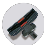
Bocchetta polvere con ruote RD 285